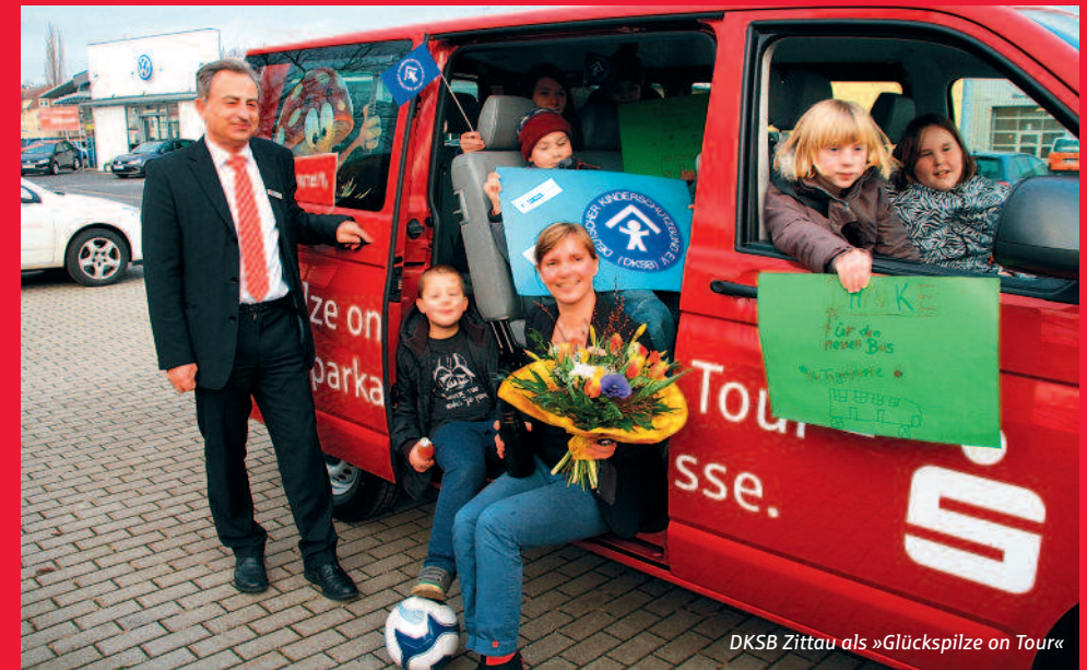
DKSB Zittau als »Glückspilze on Tour«