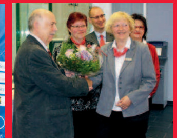
Wiedereröffnung Filiale Hirschfelde